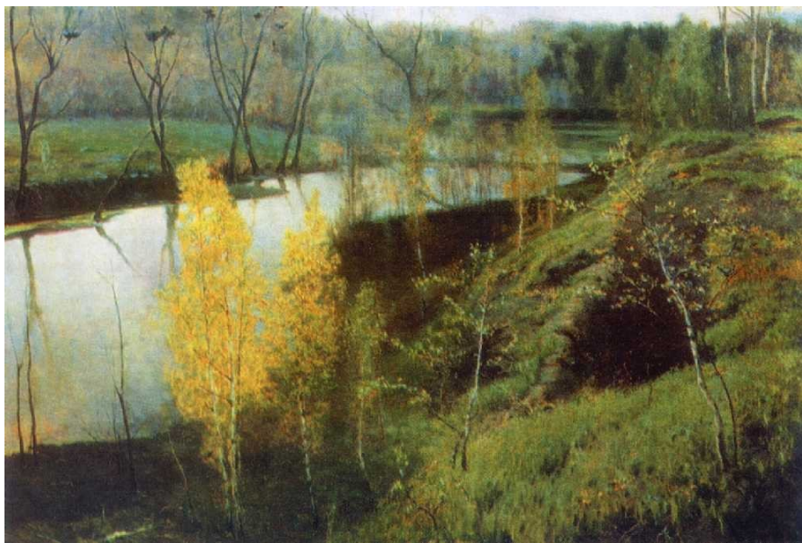
И.Остроухов «Первая зелень»