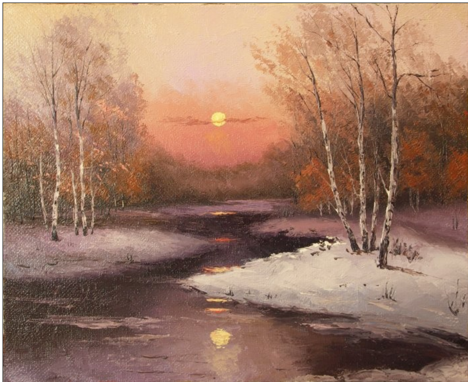
«Зимнее утро» А.Ю. Хохорь