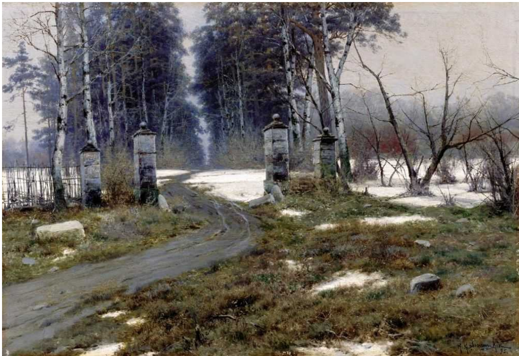
Крыжицкий К. Я. «Пейзаж»