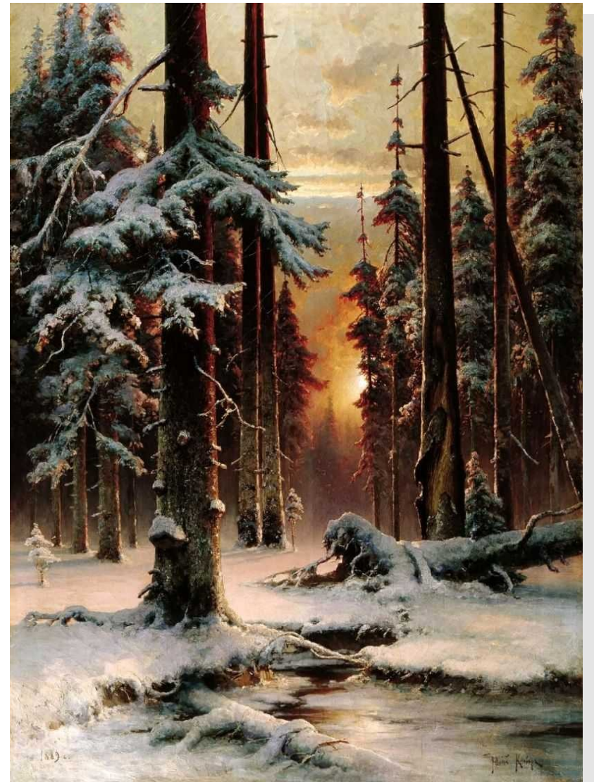
Клевер Ю.Ю. «Зимний закат в еловом лесу»