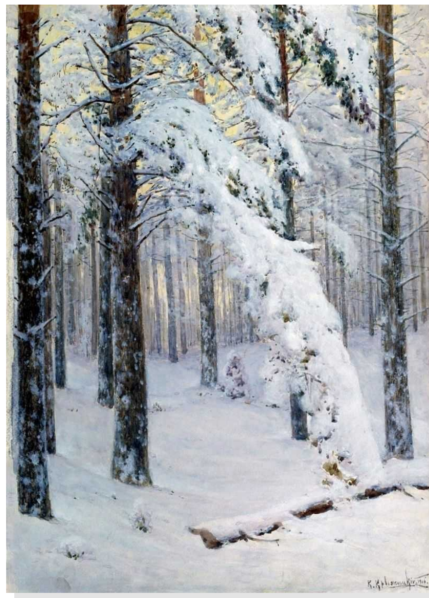
Крыжицкий К.Я. «Дорога»