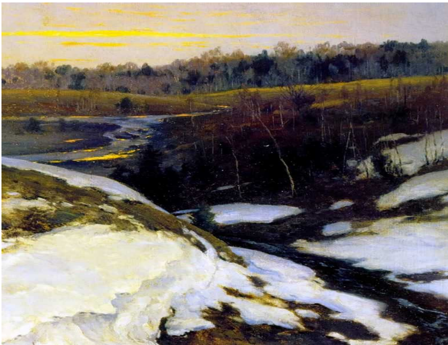
Крыжицкий К.Я. «Ранняя весна»