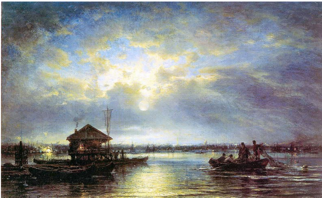
«Летняя ночь на Неве» Боголюбов А. П.