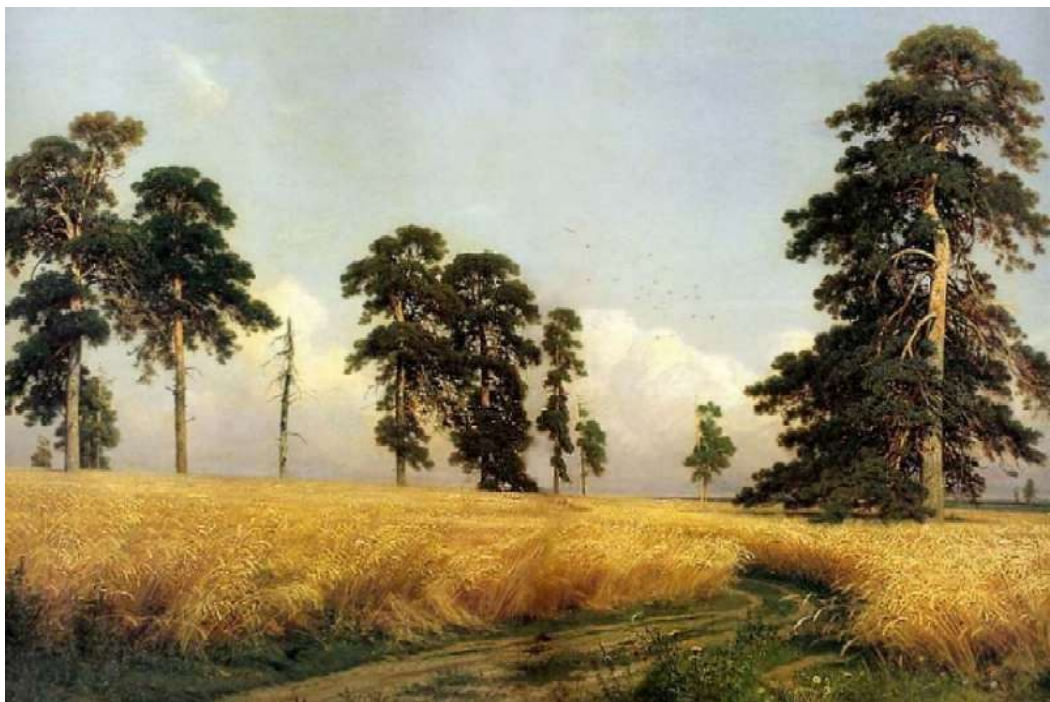
И.И. Шишкин «Рожь»