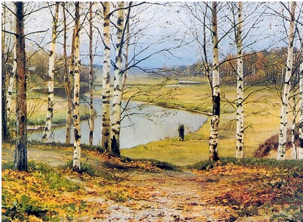
«Октябрь» Волков Е.Е.