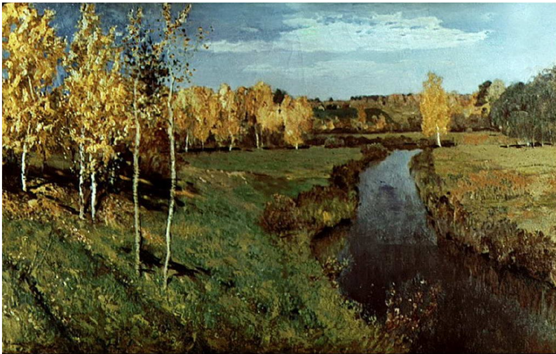
Левитан И.И. «Золотая осень»