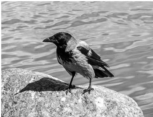
На страже порядка. Серая ворона