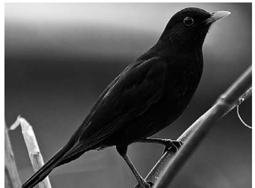
Встревоженный. Черный дрозд