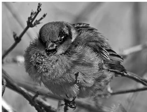
Характер нордический. Воробей