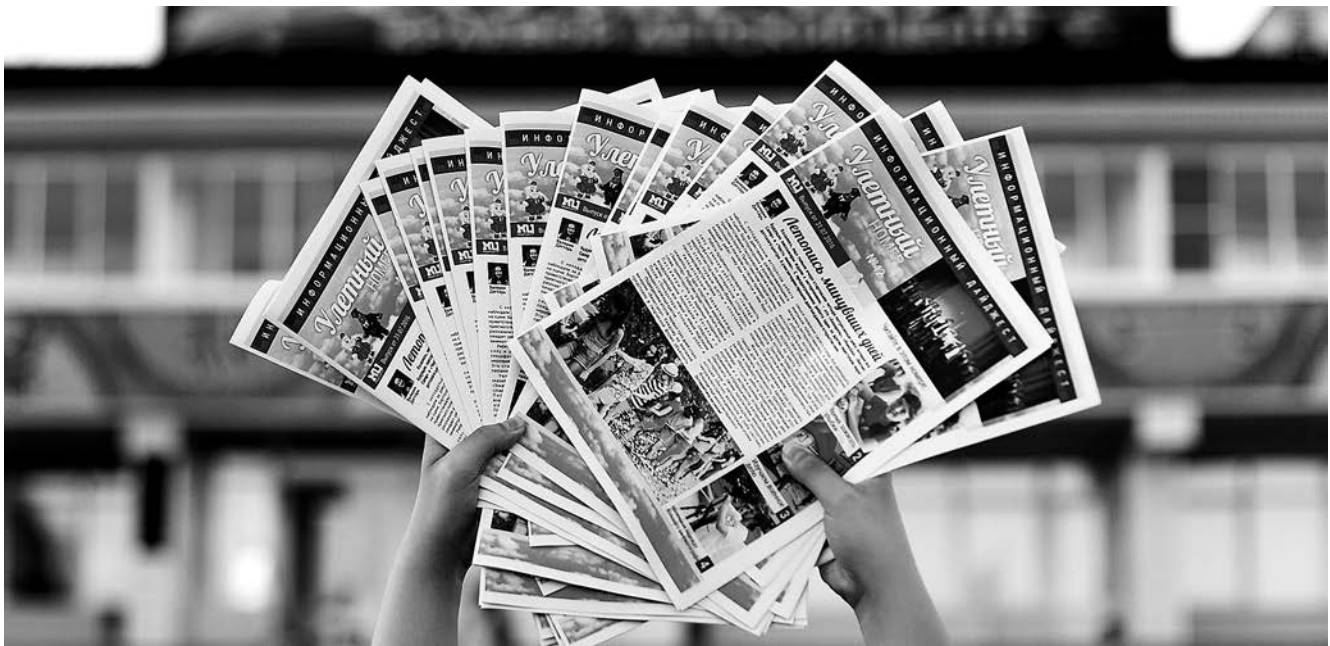
«Улетный номер», медиациентр «Созвездие», Хабаровск