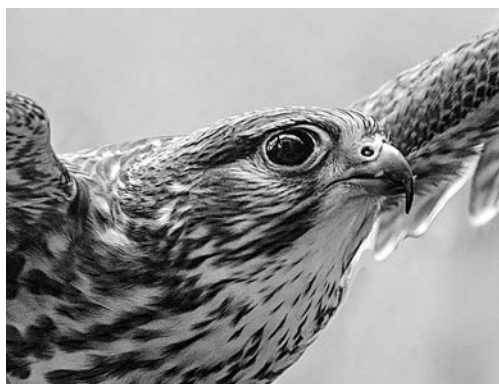
Размах крыла соответствует размаху нрава. Пустельга