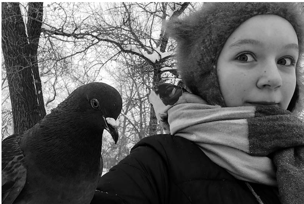
Друг мой голубь. «Летучка», Калининград