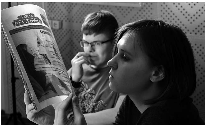
Единый день заседания школьных редакций. Медиастудия «Еще», Железногорск-Илимский