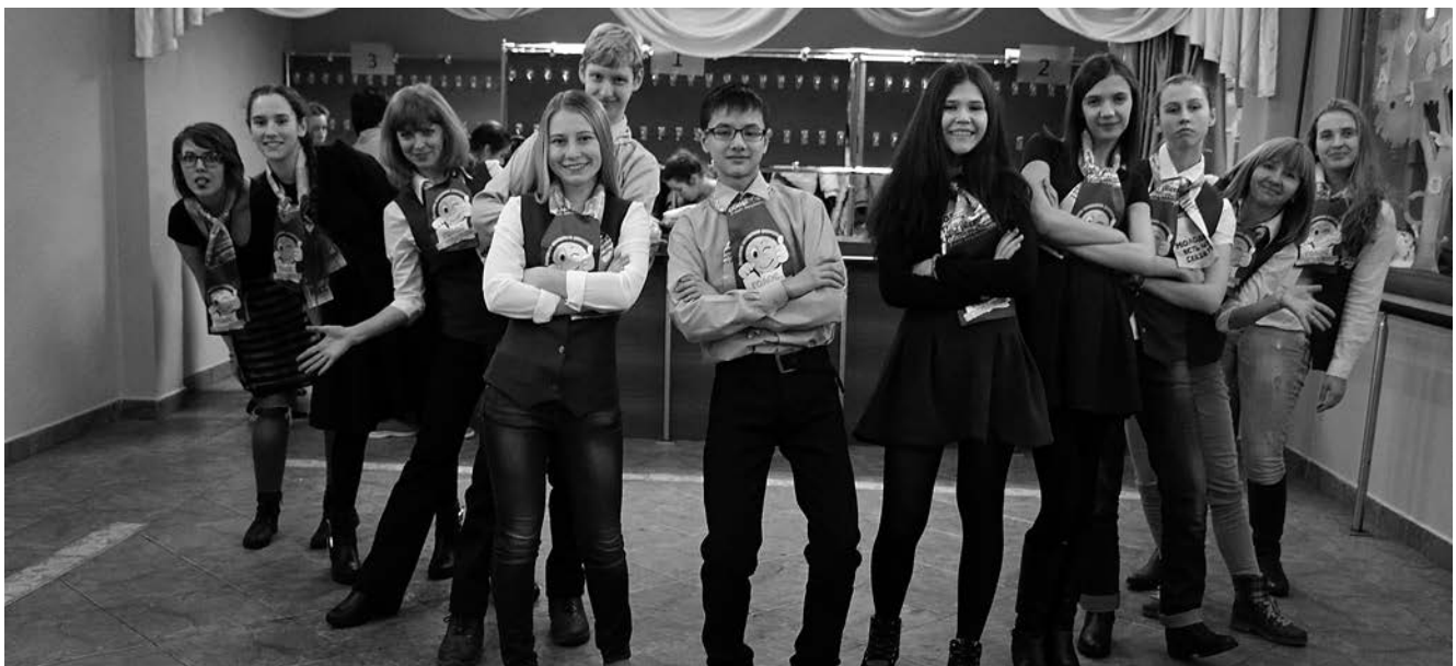
«Голос поколения. Хабаровск»