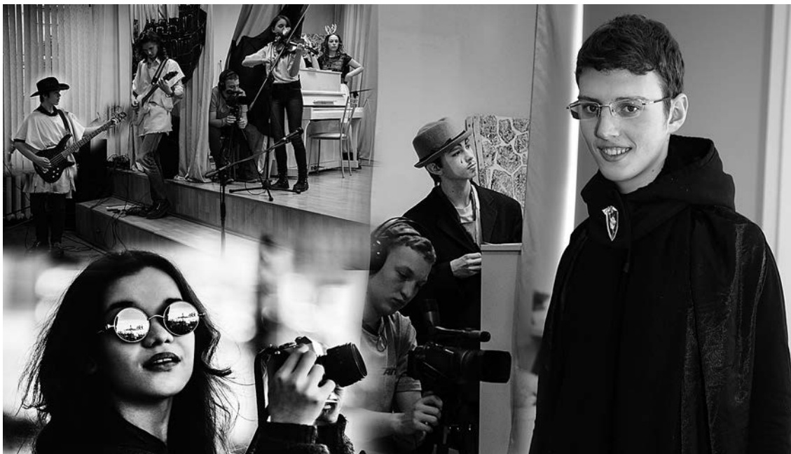
Газета «Левда», Санкт-Петербург

Вот у взрослых есть множество всяких газет и порталов. И у них есть своя правда . А у нас — своя левда .