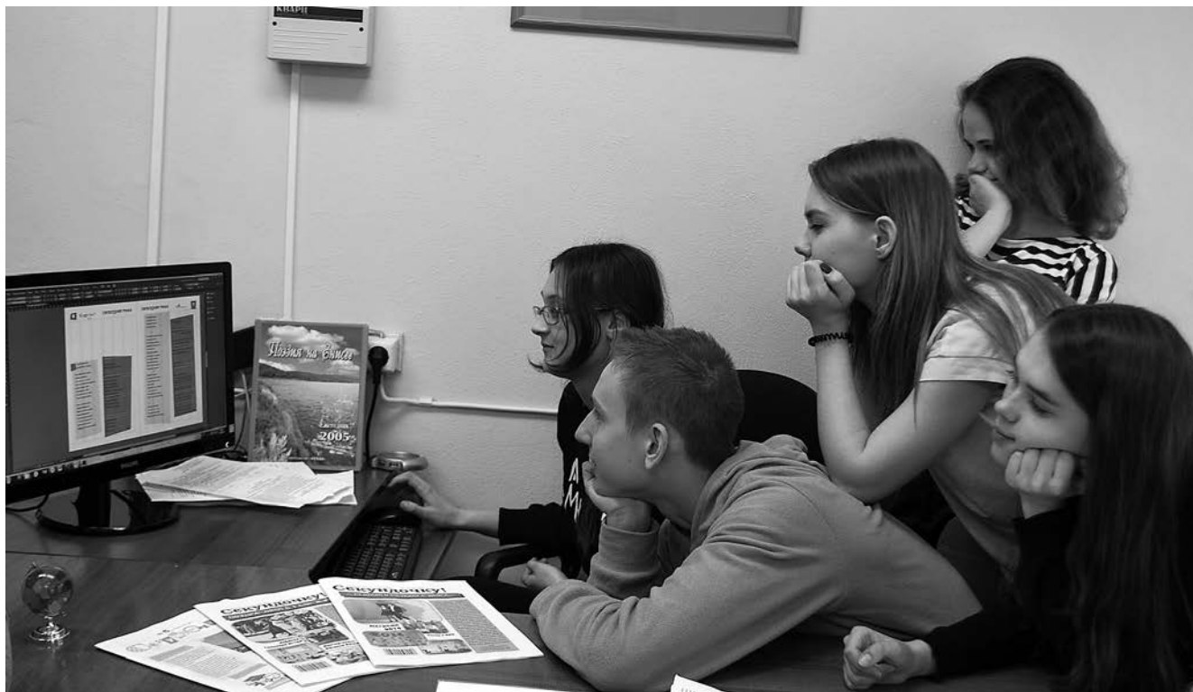
В редакции газеты «Секундочку!»