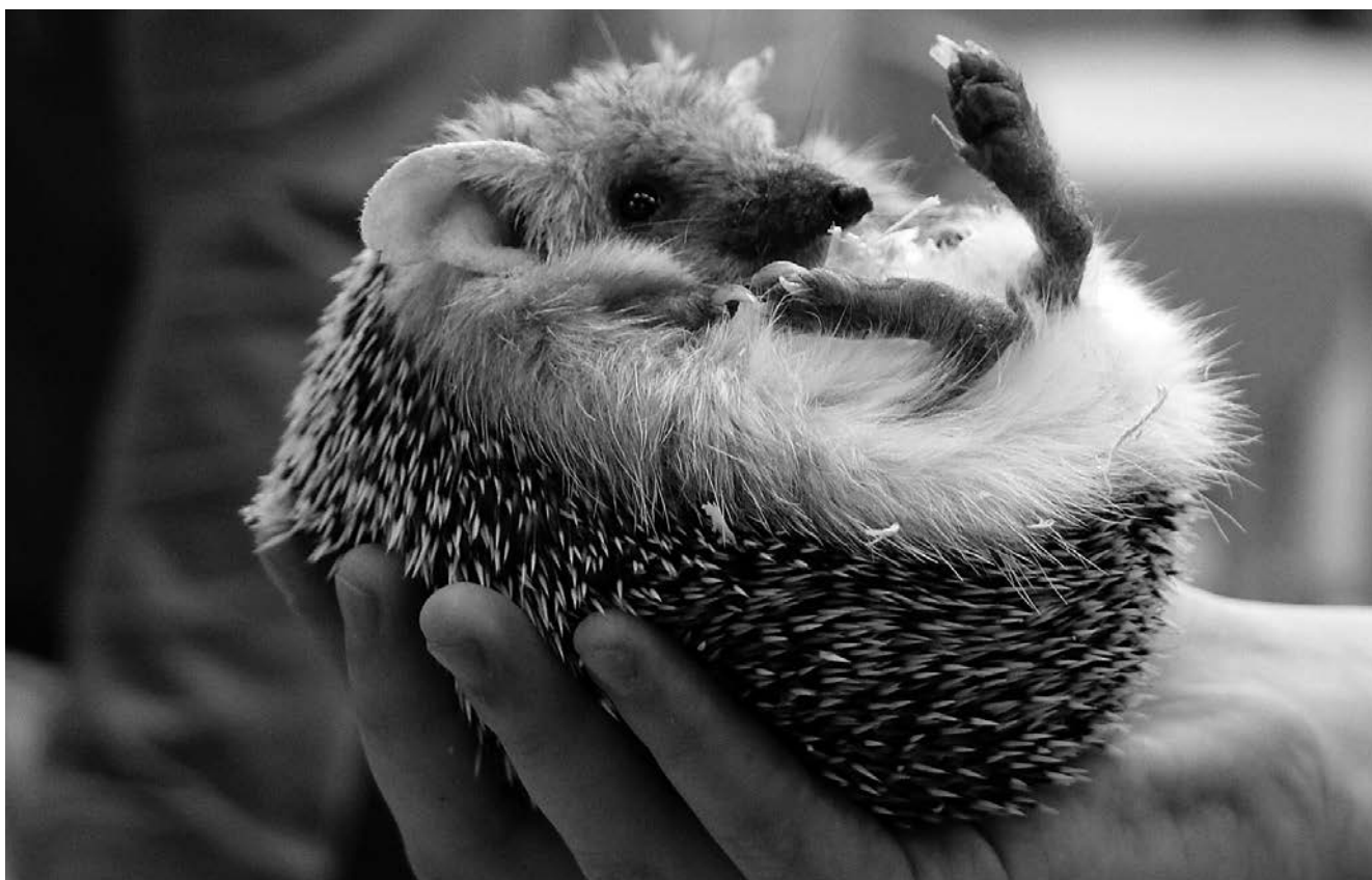
Спаси ежика, сдай батарейку

Спасали ежей мы потому, что одна батарейка, выброшенная в мусор, загрязняет ровно такую территорию, на которой могут обитать один еж, два дерева или тысячи червей. Итак, выбрасывать на свалку такие опасные отходы нельзя. Нужно отдавать их на утилизацию,