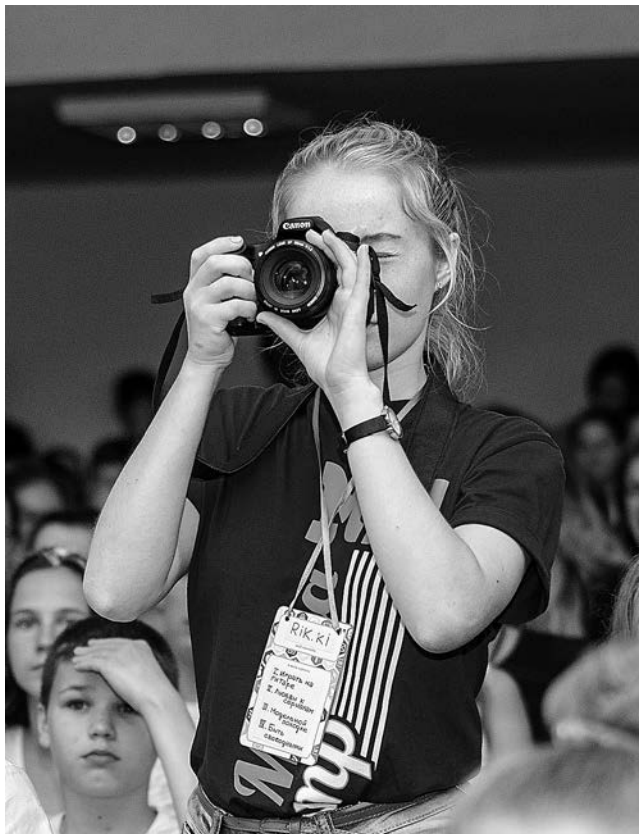
«Улётный номер», медицентр «Созвездие», Хабаровск

Но, несмотря ни на что и смотря на все, в любое время, в любых условиях, главная мысль, которая удерживала от поспешных решений, примиряла с неизбежностью перемен, учила выходить из положения, вдохновляла на продолжение — это мысль обо всех нас, называемых «участниками проекта», связанных уже многими годами общей истории, общими заботами, успехами, проблемами, человеческими тяготениями... Есть чем дорожить. Потому что это мы сделали.