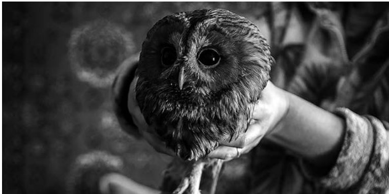
С Солнышком таких проблем не возникает, она дает себя погладить и сфотографировать