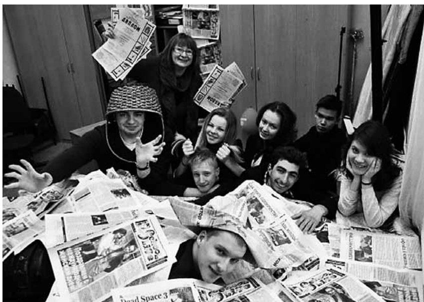
Автор: Анна Иванова, школа № 606, Пушкин, Санкт-Петербург

Много раз хотелось все бросить — когда на занятие приходит 1–2 человека, когда пишут какую-то галиматью, когда невозможно сесть на маршрутку до работы и когда нужно заполнять классный журнал (ненавижу!). Но знаю, что меня еще не скоро отпустит. Что звезды с трудом, но зажигаются, и что это кому-то да нужно. А я могу по своему рецепту хоть немного, совсем чуть-чуть, но творить свой собственный, интересный, в чем-то опасный, загадочный газетный мир.