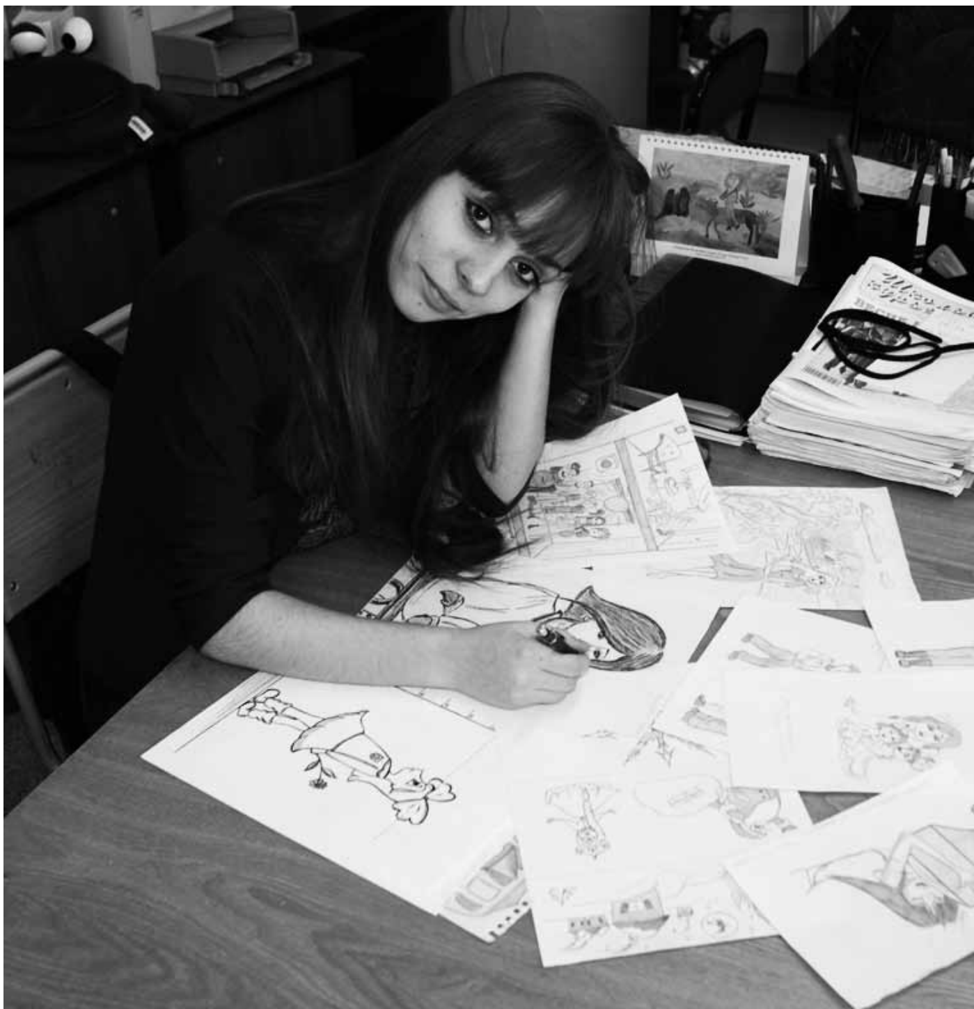
Автор: Людмила Красилина, заведомо центра внешкольной работы «Планета взросления», Хабаровск