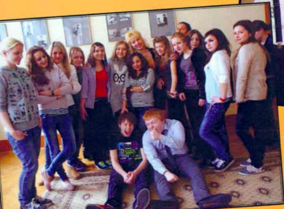
Верстка и дизайн Анастасии Фастовец